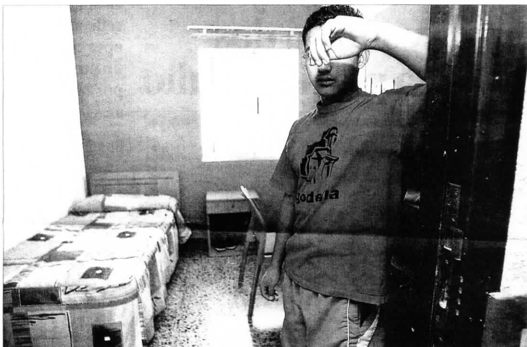
Un joven ecuatoriano, en su habitación del centro de reeducación de la Colonia San Vicente Ferrer de Burjassot.